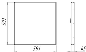
Рисунок 1 Светильник «L-office 32 Standart/Em», «L-office 55 Standart/Em »

1.7 Общий вид и габаритные размеры светильника показаны на рисунке 1.